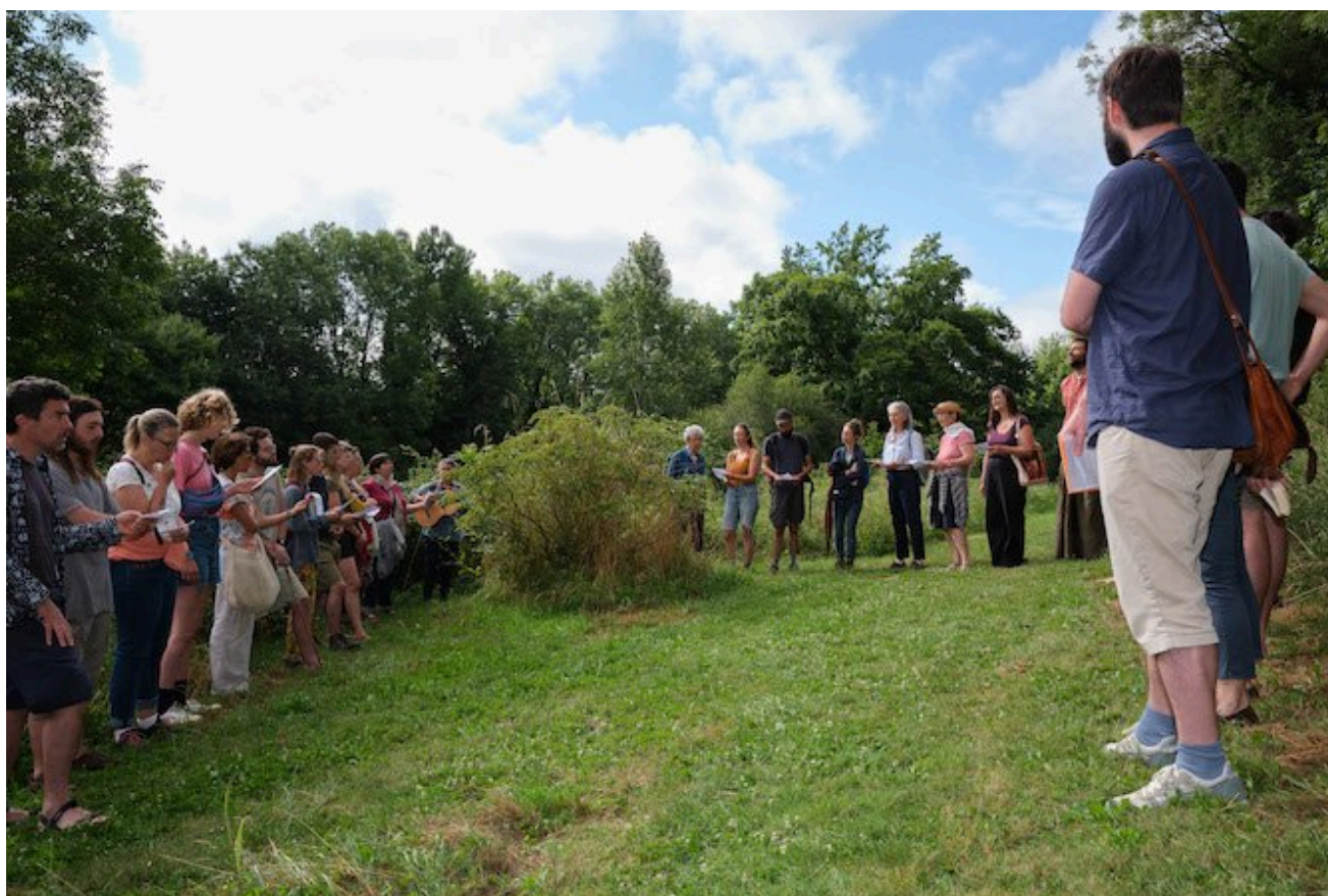
Célébration en plein air à l'arboretum de Melle, le 21 juillet 2024.

Dimanche 21 juillet, 9 h 30, à Melle (Deux-Sèvres). Alors que les hélicoptères des forces de l'ordre tourbillonnent dans le ciel, ils sont une quarantaine de chrétiens à converger vers l'église romane de Saint-Hilaire pour une cérémonie religieuse.